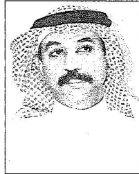
عدادي بن تترك