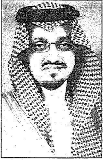
الأمير فيصل بن خالد

العالمية، وهو هدف يجب أن تتضافر من أجل تحقيقه جهود القطاعين العام والخاص معا.