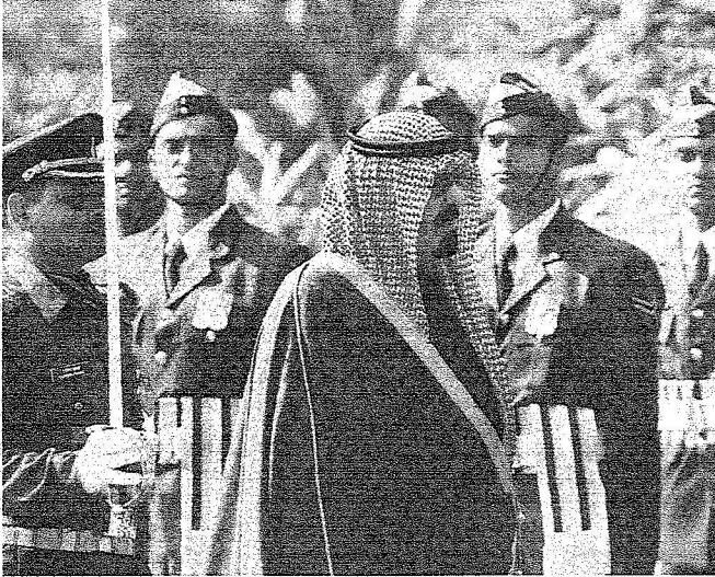
الملك يستعرض حرس الشرف الرئاسي الهندي

الأمير ماجد بن عبد الله بن عبد العزيز ومعالى وزير العمل الدكتور غازي بن عبد الرحمن القصيبي ومعالى وزير المترو والذروة المهندس علي بن إبراهيم النعيمي ومعالى وزير المالية الدكتور إبراهيم بن عبدالعزيز العساف ومعالى وزير الثقافة والإعلام الأستاذ اباد بن أمين مدني ومعالى رئيس الديوان الملكي الأستاذ خالد بن عبدالعزيز التويجري ومعالى رئيس المراسم الملكية الأستاذ محمد بن عبد الرحمن الطيبي ومعالى رئيس الشؤون الخاصة لخادم الحرمين الشريفين الأستاذ إبراهيم بن عبد الرحمن