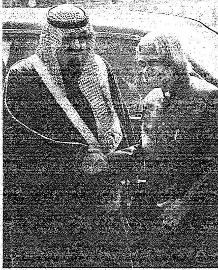
الرئيس الهندي يرحب بخادم الحرمين

لجمهورية الصين الشعبية استغرقت عدة أيام تلبية لدعوة تلقاها من فخامة الرئيس الصيني هو جين تاو، وكان في وداعه أيده الله لدى مغادرته مطار بكين الدولي معالي نائب وزير الخارجية الصيني لي جن جان وسفير خادم الحرمين الشريفين لدى المملكة الحجيلان وسفير الصين لدى المملكة وو تشونجهاو وعدد من المسؤولين الصينيين وأعضاء سفارة خادم الحرمين الشريفين لدى الصين. وقد غادر بمعية الملك المفدى أعضاء الوفد الرسمي المرافق. حفظ الله خادم الحرمين الشريفين في سفره وإقامته.