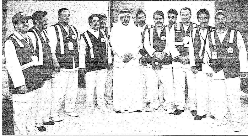
خالد الفيصل امير منطقة مكة المكرمة مع د. المناع وقياديي وزارة الصحة

من جانبه قال مستشار منظمة الصحة العالمية الدكتور عوض ابو زيد ان نجاح تقديم الخدمات الصحية بمستوى عال نتيجة طبيعية لعمل دؤوب ودقيق انعكس بشكل مباشر على صحة جميع الحجاج الذين سجلوا معدلات قياسية في عدد الحضور. وتنوه ابو زيد بان الاعلان الرئيسي حول خلو موسم الحج بدون رصد أي مرض وبائي أو منجبري كان بفضل إشراف