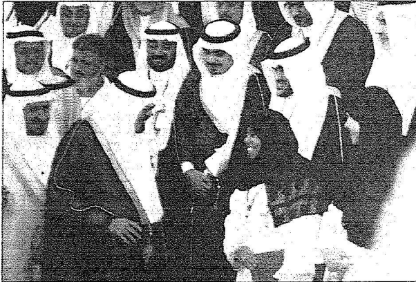
خادم الحرمين يتحدث إلى إحدى منسوبات المدينة الطبية

بعد ذلك تسلم حفظة الله هدية تذكارية من معالي وزير الصحة بهذه المناسبة تم التقطت الصور التذكارية معه حفظة الله من قبل منسوبي المدينة وبعدها عزف السلام الملكي وغامر حفظة الله الحفل بمثل ما استقبل به من حفاوة وتكريم .