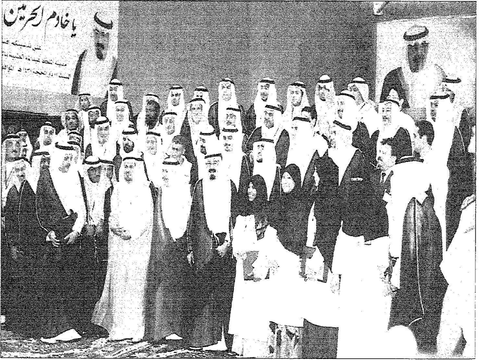
خادم الحرمين في صورة تذكارية مع الطاقم الطبي بحديقة الملك عبدالله الطبية

رعى افتتاح مدينة الملك عبدالله الطبية بالعاصمة المقدسة ومستشفى منى الوادي