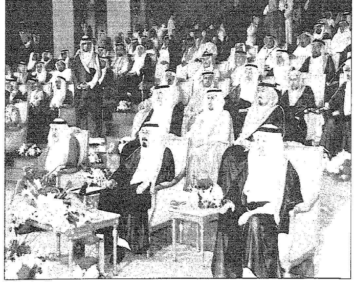
خادم الحرمين وراي جواره الأمير نكف و الأمير عبد الإله خلال افتتاح المشروع