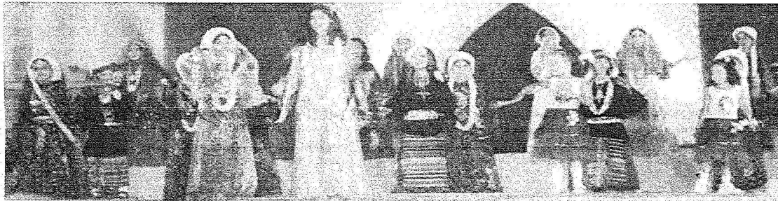
احتفالات الامهالي بالزيارة الميمونة لخادم الحرمين وصحبه الكرام

وجنابا وزارة الجترول والفروة المعدنية براسة إنشاء مصفاة للبترول في منطقة جازان. أيها الإخوة أيها الأبناء: قلت سابقاً، وأكر أمامكم الآن أنه لا يوجد فرق بين منطقة ومنطقة أخرى، أو بين مواطن ومواطن، فالوطن واحد، والمواطنة واحدة كذلك. أشركم، وأقدر لكم هذا الاستقبال الحار المؤثر، وأنتفض لكم جميعا الصحة والسعادة والتوفيق. والسلام عليكم ورحمة الله وبركاته. وكان خادم الحرمين الشريفين