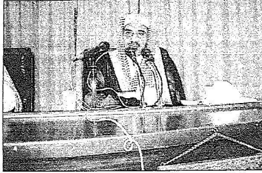
ابن حميد خلال المحاضرة