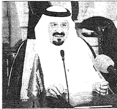
الأمير سلطان : زيارة الملك لتركيا محل تقدير الجميع

اعرب سموه عن أمله أن تكون هذه الزيارة إن شاء الله داعمة للعلاقات العسكرية والاقتصادية بين البلدين . وأضاف سموه قائلاً " كل ما نتوخاه أن تتطور هذه العلاقات بتبادل الزيارات بين المسؤولين وفي نفس الوقت أؤكد أن زيارة خادم الحرمين الشريفين الملك عبدالله بن عبدالعزيز آل سعود قبل سنتين إلى تركيا الصديقة كانت محل تقدير الجميع " . بعد ذلك التقى وزير الدفاع التركي كلمة عبر في مستهلها عن امتنانه وتقديره لسمو الأمير سلطان بن عبدالعزيز على الدعوة التي وجهت له وعلى ما لحقه وأعضاء الوفد من حسن استقبال وكرم ضيافة وأعرب عن اعتزازه بلقائه سمو الأمير سلطان بن عبدالعزيز الذي كان يتطلع إليه منذ توليه مهام وزارة الدفاع بتركيا لتبادل الأراء بما يدعم العلاقة بين البلدين الصديقين