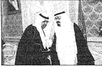
سمو وزير الحريية يتشرف بالسلام على خادم الحرمين