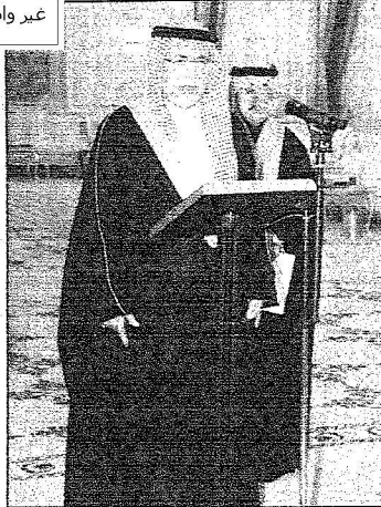
د. عبدالعزيز خوجة يؤدي القسم بين يدي خادم الحرمين