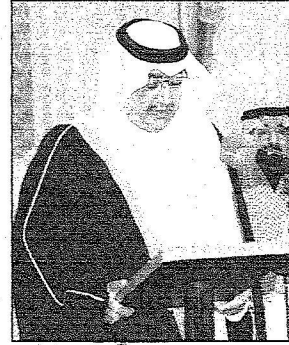
سموه يؤدي القسم