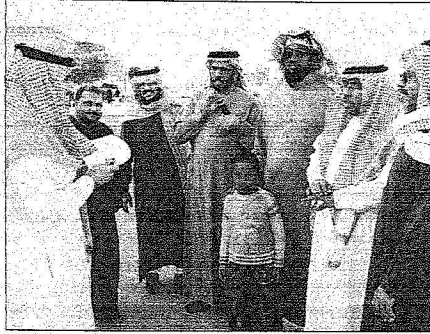
عدد من الأهالي مع المحر يعبرون عن فرحتهم بعد سماع الخبر