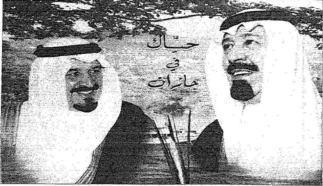
لائحة ترحيبية بالملك وولي العهد احتفاء بمقدمهما إلى منطقة جازان اليوم.