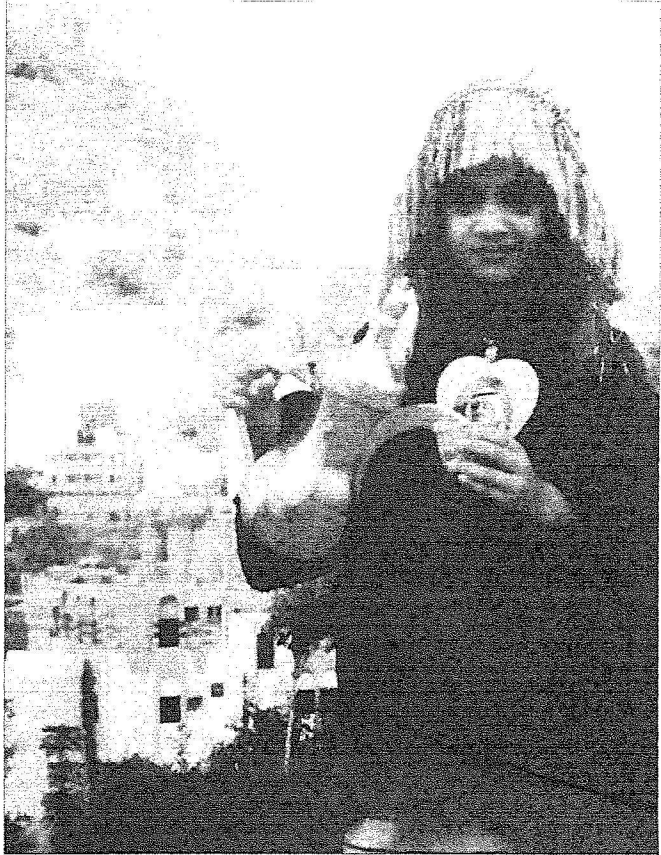
لوحة تعكس فرحة أهالي جازان بزيارة خادم الحرمين الشريفين وولي عهده.