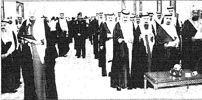
الشيخ وأعضاء الشورى يتشرفون بأداء القسم أمام خادم الحرمين