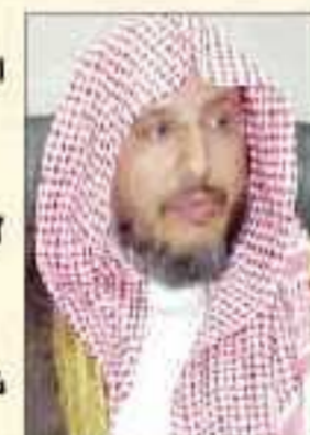
إبراهيم بن شايح الحقييل رئيس ديوان المظالم

رئيس ديوان المظالم : انتقال الدوائر الجزائية والتجارية لتصبح محاكم مستقلة لن يؤثر على معييرات وكادر العاملين.