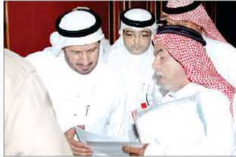
وزير الصحة د. عبدالله الربيعه يطلع على شكوى مواطن

٢/١٨ : "الصحة" تحدد ٤٨ ساعة الوزير يستدعي مديري للتفاعل مع وسائل الإعلام الصحة لمناقشة ٦٠ مشكلة. ٥/٢٣ ٢/١٩ : إطلاق إستراتيجية تطوير النظم الصحية في غرف العمليات يهدف توسيع قاعدة الوصول إلى خدمات الرعاية الصحية بجودة عالية، وذلك بتكثيف مستشفيات ٢/٢٠ : الوزير يقوم بزيارة تفقدية لمستشفى النور ومدينة الملك عبدالله الطبية بمكة. ٢/٢٨ : تحسين العمليات الإدارية والفنية بغرف العمليات التي تعتبر العنصر الأساسي في أي مستشفى. ٣/١٤