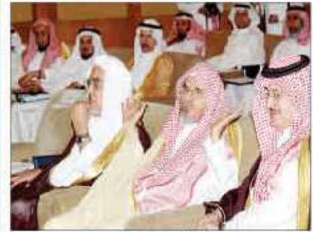
د. صالح بن حميد خلال أحد اللقاءات