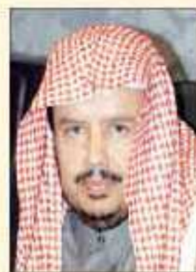
د. عبد الله بن محمد آل الشيخ رئيس مجلس الشورى

رئيس الشورى يرأس اجتماع مدراء الإدارات العامة و يتلقى رسالة من رئيس مجلس الاتحاد لروسيا الاتحادية سيرجي ميرينوف