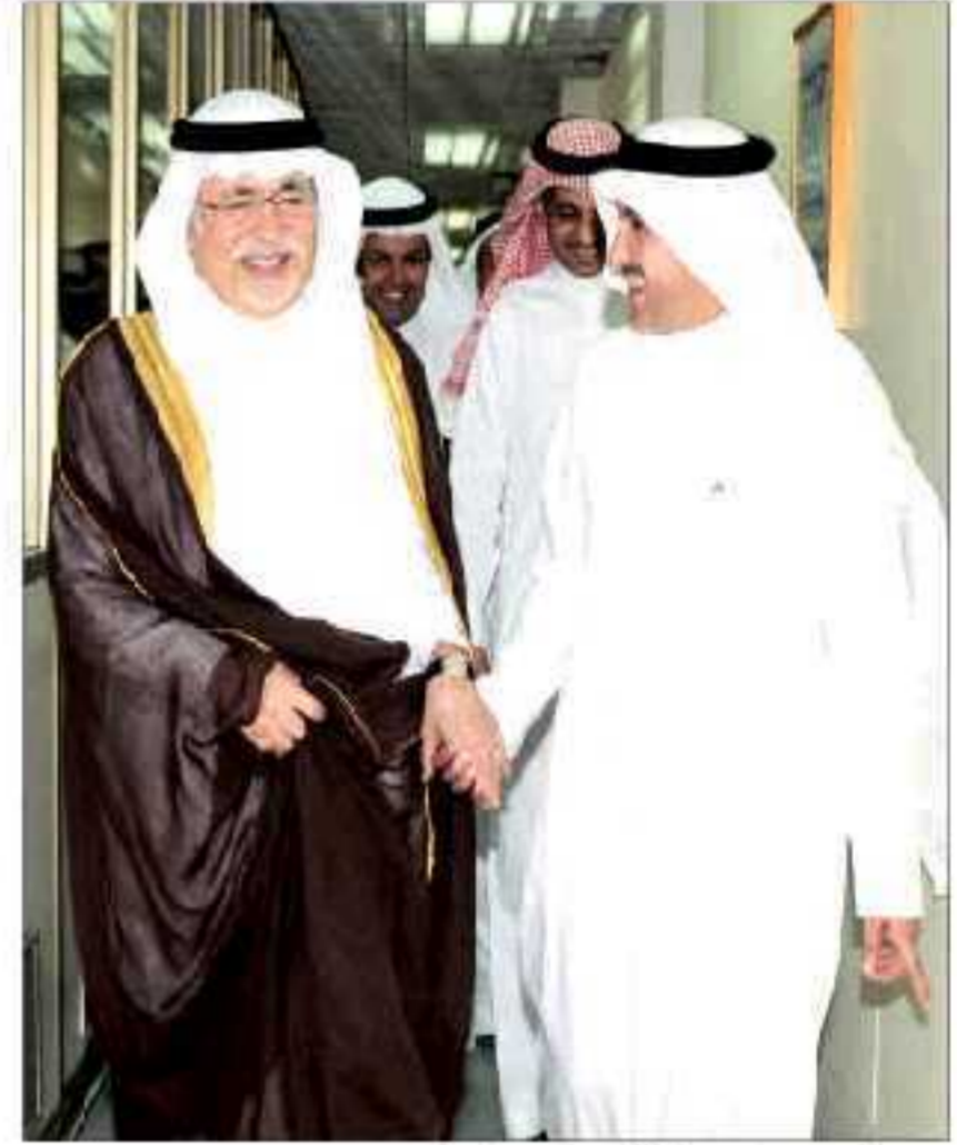
د. عبدالعزيز خوجة وزير الثقافة خلال زيارته للمدينة