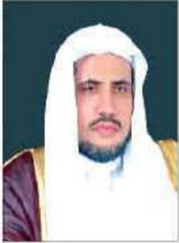
د. محمد بن عبدالكريم العيسى وزير العدل