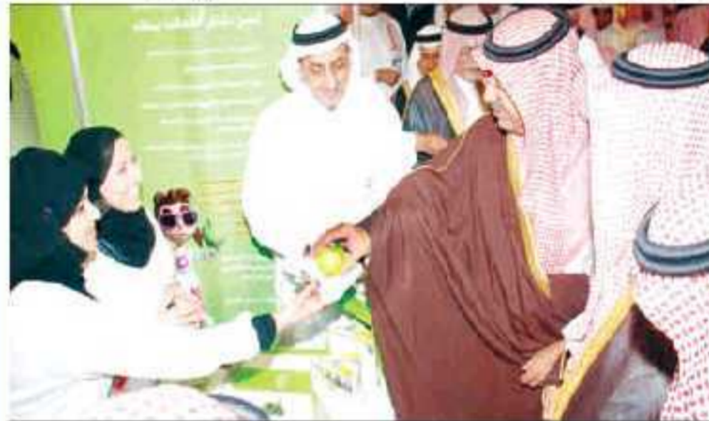
الأمير فيصل بن عبدالله خلال جولته التفتيشية

تحت شعار وشركاء في التطوير « لبحث الخطة التوسعية لمدارس مشروع التطوير.