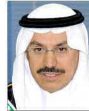
د. محمد بن سليمان الجاسر محافظ مؤسسة النقد العربي السعودي

١٩ مارس : الجاسر يرعى منتدى تأمين الائتمان الصادرات ويقول: إن نمو الصادرات غير النفطية يؤكد نجاح تنوع الموارد. ٢٦ مارس : د. الجاسر بالمنامة : المملكة مستعدة لزيادة مساهمتها في صندوق النقد ولست بحاجة إلى إصدار سندات حكومية ٣ أبريل : العساف والجاسر يحددان موقف المملكة من تحفيز الاقتصاد العالمي : لن نورد المليارات في صندوق النقد وأموالنا ستبقى تحت ناظرينا. ٥ مايو : الجاسر يحضر تجمع خليجي أوروبي بالرياض للتصدي لعمليات غسل الأموال وتمويل الإرهاب ويؤكد على هامشه أن الاقتصاد السعودي محصن ضد العمليات المشبوهة. ١٨ مايو : الجاسر يفتتح مؤتمر التأمين السعودي الثالث ويؤكد: نمو سوق التأمين ٢٧٪ واعتماد ٩ شركات جديدة. ١٩ مايو : الجاسر يفتتح مؤتمر يوروبوني السعودي : الاقتصاديات المتقدمة أخطأت في فكرة تنظيم الأسواق لنفسها.