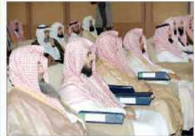
جانب من ندوة النظام القضائي الجديد