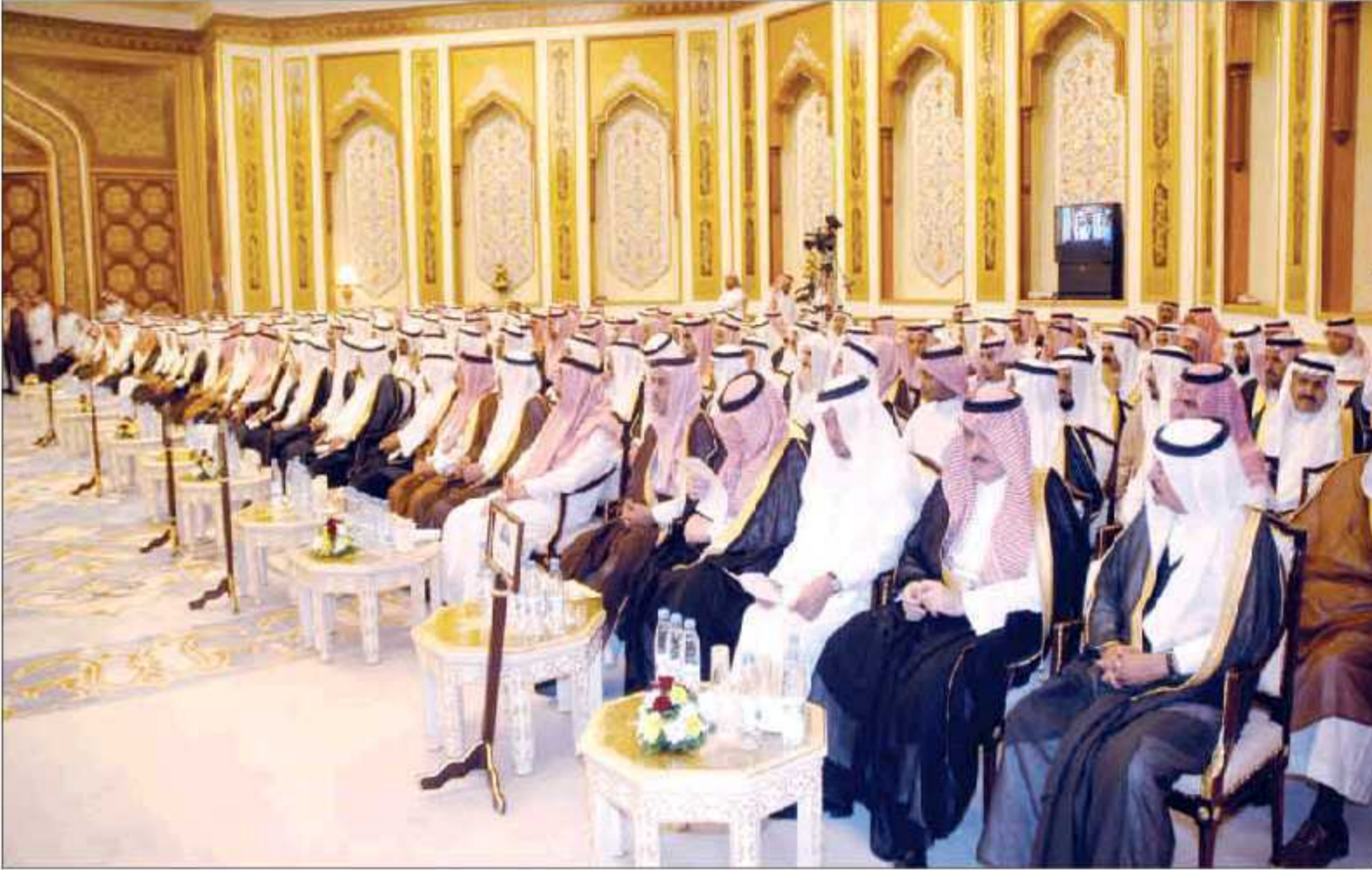
أعضاء مجلس الشورى