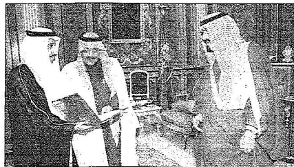
الملك يستقبل الأمير نايف

وأرجو احاطتكم بأنه في اطار حرص الديوان على تنفيذ التوجيهات السامية والتوضيح بالهامم الرقابية بكل حيطة ومصونوية وكفاءة مهنية عالية والاسهام الفاعل في ترجمة الضاميم الجوهرية لسياسة الإصلاح الضالكم كما أصدرت في الخطاب السامي في افتتاح دورة مجلس الشورى بتاريخ السادس عشر من ربيع الاول عام 1424 هـ على عفرن عمل يتخذ في أرض الواقع فقد يادر إلى اعداد خطة استراتيجيّة ذات أهداف محددة ترمي الى تعزيز دور الديوان في تطبيق مفهوم الرقابة الفاعلة على جميع الاجهزة الحكومية والؤسسات والشركات المشمولة برقابته دون استثناء والحفاظة على موارد