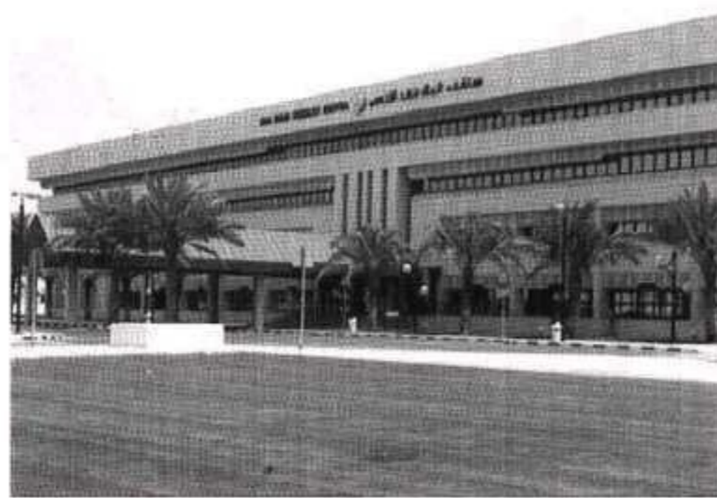
مستشفى الملك فهد التخصصي بالدمام