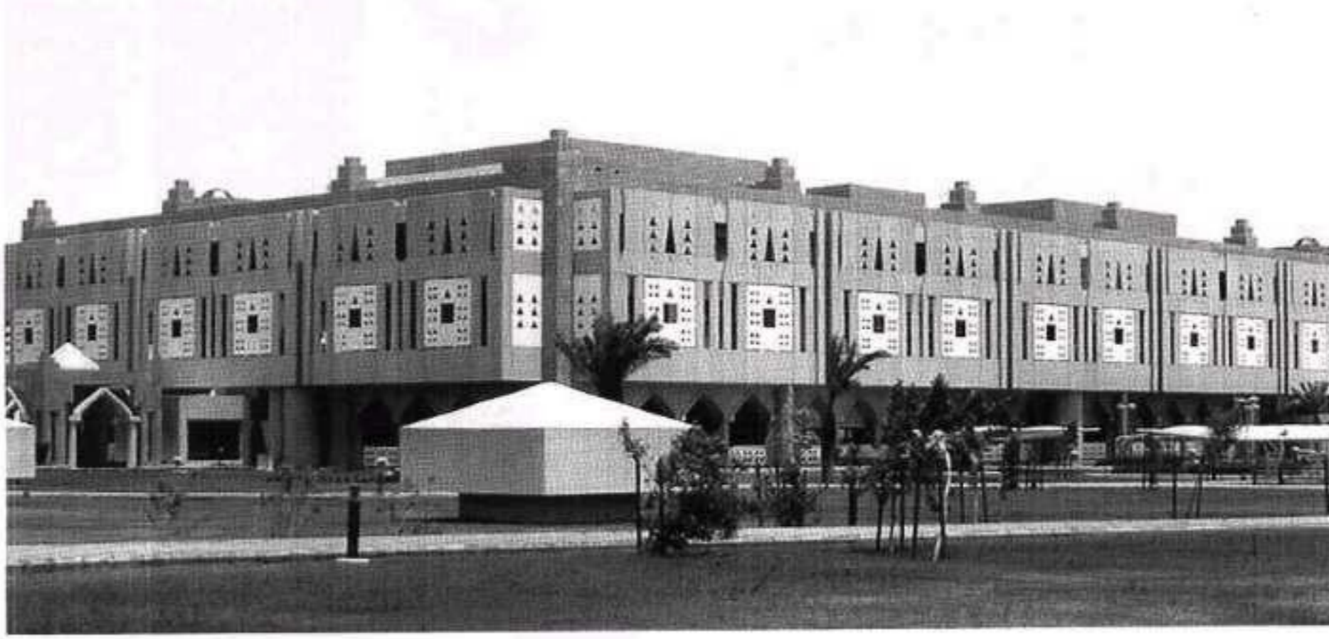
مبنى إمارة منطقة تبوك

في الاعتبار الاحتياج الفعلي للبناء ومقدار التأثير والتأثير فيه على الجوانب الأخرى في مجمل الخطة، ولا يخفى بأن أهم أهداف صناعة البناء هي: - توفير الاحتياج اللازم من المباني سكنية كانت أم خدمية من خلال الإنفاق العام أو الخاص. - تشغيل الصناعات المحلية القائمة ذات العلاقة وتفعيل مراكز البحوث والجامعات والمعاهد الفنية ذات العلاقة. - توفير فرص العمل للمواطنين واستيعاب ما يخصصها من مخرجات المعاهد والجامعات من خلال العمل المباشر في هذا القطاع أو الصناعات المرادفة. فمن حيث الكم فإن صناعة البناء حالياً في ازدهار ولكن الكثير مما هو مؤمل منها لم يتحقق فهي ما زالت قائمة وينسبة كبيرة على الأساليب التقليدية؛ والتي تعتمد بكاملها على الأيدي العاملة مما يستوجب استخدام أعداد كبيرة منها. فلو تم قبوله عناصر هذه الصناعة بنماذج وتصاميم متعددة ترضي جميع الأذواق لأمكن تصنيعها ألياً