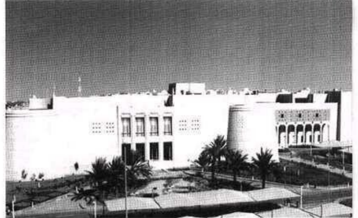
مبنى إمارة منطقة القصيم