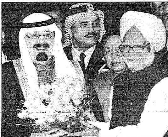
خادم الحرمين لدى مغادرته نيودهي ورئيس الوزراء يقدم له - حفظه الله - باقة من الزهور في ختام زيارته للهند

كما التقى خادم الحرمين الشريفين بالسيدة سوئييا غاندي رئيسة حزب المؤتمر وحزب الائتلاف الحاكم بمقر اقامته وطرح معها نتائج الزيارة.