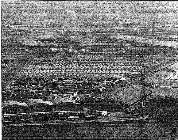
الحركة التجارية لا تتأثر في أيام الاجازات