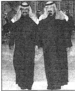
ويصلحيه لحفل العشاء