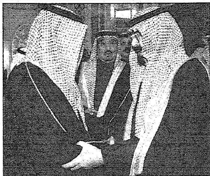
الملك عبد الله ملك الأردن مع الملك عبد الله ملك السعودية الكوييتيين