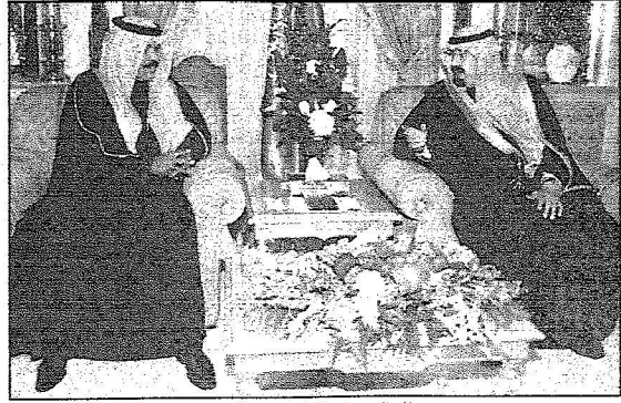
خادم الحرمين يستقبل ولي عهد الكويت

خادم الحرمين استقبل ولي عهد الكويت والوفد المرافق