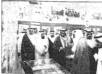
جانب من جولة الأمير محمد بن ناصر في صيبا

والخدمية بالمحافظة في مختلف المجالات ، كما تفقد احتياجات أهالي الحزام الجنوبي والغربي والزبارة والمجستير والخاندية ومنامة وصليل والحزام الغربي والعدايا ومركز القوز والقرى التابعة له من المشروعات الخدمية التابعة له من المشروعات الجارية كمشروعات الجارية تنفيذها بالمحافظة ومنها بعض المشروعات التابعة للمديرية العامة للمياه بالمنطقة التي تقوم حاليا بتنفيذ عدد من المشروعات في مجالات المياه والصرف الصحي والسدود التابعة للمديرية العامة