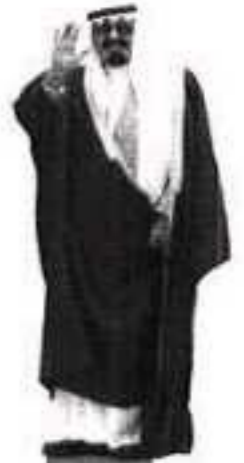
ملك الوفاء... مع فقير العطاء

- نعم حسب الإحصائيات المنشورة والتي نطلع عليها من وقت لآخر في صحف المملكة وعلى لسان المتخصصين فإن حاجة المدن الرئيسية لمزيد من المساكن في تزايد مستمر يدعم ذلك كون نسبة كبيرة من سكان المملكة من صغار