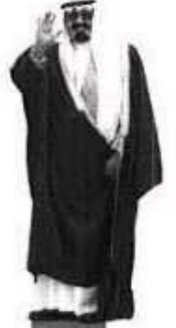
ملك الوفاء... مع قصيم المطاير