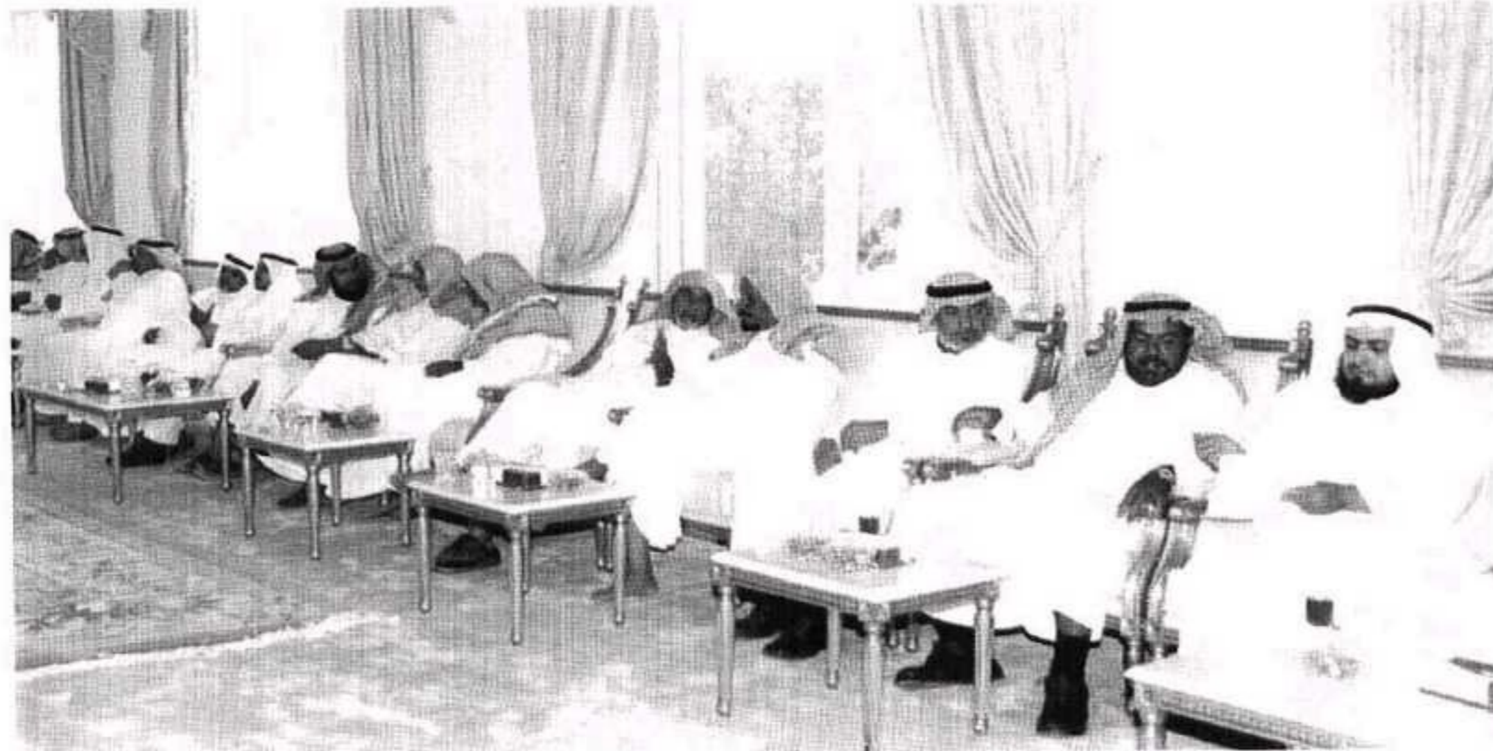
الأمير فيصل بن بندر أمير القصيم الأولي ١٤٢٧هـ