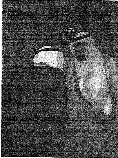
الملك عبدالله بن عبدالعزيز يستقبل امراء المناطق