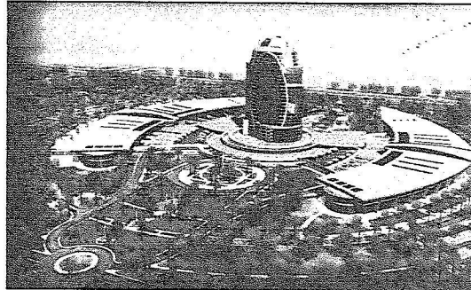
لطة عملة لتصميم مشروع جمعية المتقاعدين في الرياض

عملية الإسكان للمتقاعد وللأسف ما قدمته مؤسسة التقاعد لا يفيد التقاعد بقدر ما يفيد الموظف الموجود على رأس العمل مثل مشروع الإسكان الذي تقدمه مؤسسة التقاعد لكن للأسف أن هذا المشروع متوقف بشرطين لا يقل نخل الإنسان إذا أراد قرضاً عن (٥٠٠٠) وهذا معناه أن أغلب المتقاعدين البالغ عددهم ٥٠ ألفاً على مستوى المملكة لن يستفيدوا منه رجال ونساء، ونحن بالجمعية نطالب من المؤسسة أن تمتح