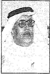
الأنصاري: التقاعد يحتاج إلى تسهيلات لشخص مسك