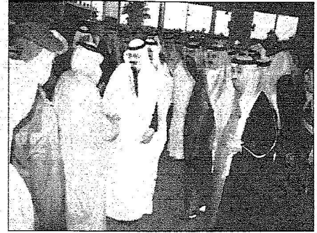
خادم الحرمين الشريفين يستقبل ضيوف المهرجان الوطني للتراث والثقافة (الجنادرية 22)

ولي عهد البحرين: الجنادرية تظاهرة فكرية وثقافية تبرز الموروثات التي تربط السعودية بالأمة العربية والإسلامية