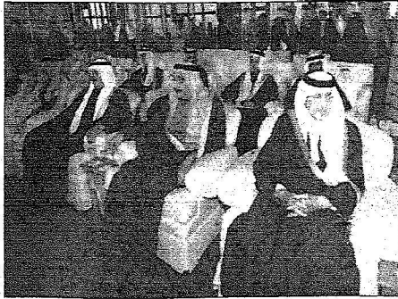
الأداء والتصوير خلال الافتتاح