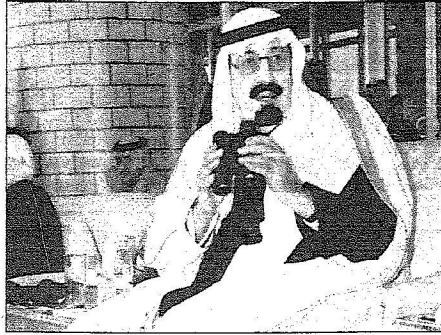
ويطالع سباق الهجن