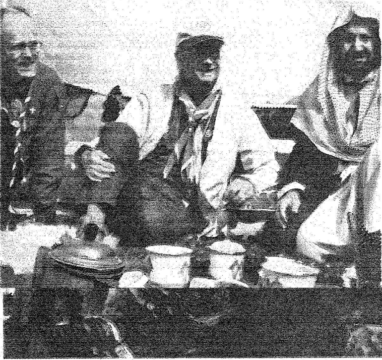
ملك السويد كارل غوستاف السادس عشر مع وزير التعليم السعودي عبد الله العبيد في مخيم الكشافة بالقرب من الرياض

وبالأخص الكشافة السعودية، من نشاطات لدعم التعايش السلمي بين الدول. وتبنت الكشافة السعودية، زيارة للملك السعودي لأحد معسكراتها المقامة في صحراء النمامة، إحدى كبريات الصحاري في المملكة. ومنذ وقت مبكر من صباح يوم أمس الخميس، خرج الملك السعودي ومرافقوه، مع مجموعة من القادة الكشفيين يرأسهم الدكتور عبد الله بن عبيد رئيس جمعية الكشافة العربية السعودية، إلى معسكر كشفي، حيث بدأ الملك غوستاف السادس عشر، مستمتعاً من خلال الصور التي التقطت له في ذلك المكان. وقضى كارل غوستاف، معظم ساعات النهار، وهو يشرف على عدد من الأعمال التي نفذها الكشافون السعوديون في تلك الرحلة، حيث شاهد كيفية صناعة القهوة، منذ مراحل إعدادها الأولى، وصولاً إلى تبخيرها بـ«الهيل العربي»، وانتهاء بشربها على الطريقة البدوية. ولم يفت القائمون على ترتيب فقرات اليوم المفتوح، الذي عاشه الملك السعودي أسس منتقلاً بين النمامة ومزرعة العاذرية، تخصيص وقت من الرحلة، لمنح الملك ومرافقيه فرصة ركوب الجمال في صحراء العاذرية، التي ختم فيها رحلته الخلوية أمس، يتناولها فيها طعام العشاء. وقيل مصدر له الشرق الأوسط، إن الملك كارل غوستاف، استمتع جداً في اليوم الذي قضاه في الصحراء، وكان متواضعاً لأقصى درجة، حتى أنه حينما وصل إلى المطار، كان قادماً على متن طائرة فرنسية، مع مجموعة من الركاب العاديين.