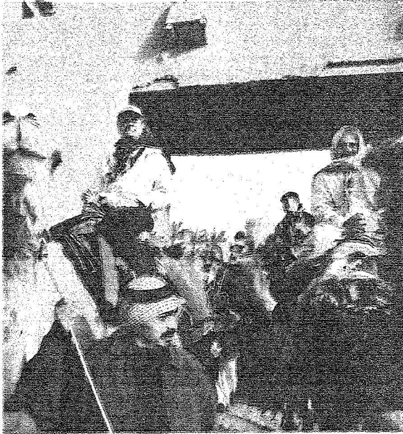
ملك السويد كارل غوستاف ووزير التعليم السعودي يمتطيان جملين خلال زيارة للملك الصحراء التمامة في العاصمة السعودية (رويترز)

بعد أن عاش يوم أمس، أجواء غير اعتيادية في صحراء التمامة في العاصمة السعودية، يتأهب الملك السعودي كارل غوستاف السادس عشر، لإطلاق دعوة للتعايش والسلام، مدعوها من نظيره السعودي خادم الحرمين الشريفين الملك عبد الله بن عبد العزيز، حيث يفتتح غدا السبت معرضا مصورا عن «السلام العالمي» من تصميم مصور ياباني. وسيشارك الإمبراطور سلمان بن عبد العزيز أمير منطقة الرياض، ملك السويد، في افتتاح المعرض الذي يحكي واقع الدور الكشفي في دعم العملية السلمية في العالم. وجاء دعم الملك عبد الله بن عبد العزيز، للمعرض الدولي، والذي تعد العاصمة السعودية محطته الأولى، بعد مكاتبات جرت بين الملكين السعودي والسويدي، حول أهمية السلام، حيث كتب الملك كارل غوستاف، خطابا للملك عبد الله يدعو فيه إلى تبني معرض «هدية السلام»، الأمر الذي تمت الموافقة عليه. وقال الملك السعودي، وهو