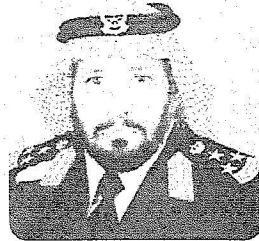
العميد سلطان المتقيين

وتقوم رؤية الملك عبد الله بن عبد العزيز للتنمية على عدم اقتصر مخطاها على المدن الرئيسية بل تشمل كافة مناطق المملكة وهذا ما تمثل في إنشاء وإطلاق المدن الاقتصادية المتكاملة في رابع وحائل والمدينة المنورة والرياض وباقي أرجاء الوطن الفالي . جعل للمملكة مكانتها وثقلها السياسي