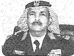
الواء بدر الربيع