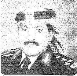
العميد عبدالله المرشود