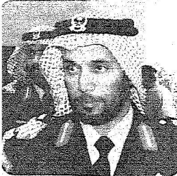
العميد عبدالرحمن المتقيين