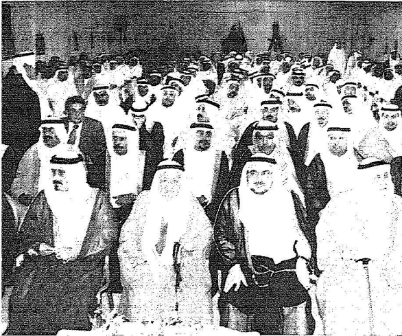
جانب من الحضور.