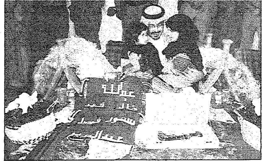
أمير حائل يحضن طفلتين من المشاركات في العرض

الأمير سعود بن عبد المحسن خلال تدشين انطلاق فعاليات مهرجان التراث والصحراء :