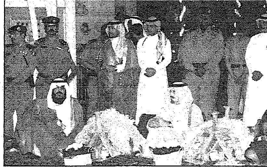
أمير حائل يشاهد العروض في الجلسة الشعبية