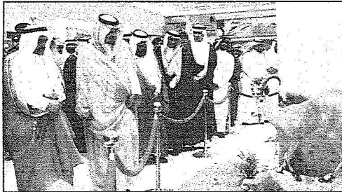
الأمير سعود مشاركة في العرضة السعودية

أكد صاحب السمو الملكي الأمير سعود بن عبد العزيز أمير منطقة حائل رئيس مجلس التنمية السياحية بحائل أن حائل ستشهد - بحسبئله الله- في العام القادم مهرجاناً دولياً يستضيف حضارات صحراوية وتراثاً صحراوياً من جميع انحاء العالم وبين سموه خلال افتتاحه لفعاليات مهرجان حائل لتراث الصحراء الاول الذي ينظمه مجلس التنمية السياحية بحائل والهيئة