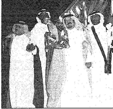
أمير حائل يطالع على أنشطة المعرض

مايستخدم المجتمعات المحلية في المملكة. وكان الحفل الذي رعاه أمير منطقة حائل في افتتاح مهرجان حائل السياحي لتراث الصحراء قد شهد ابتكار طريقة جديدة في تنظيم الاحتفالات في المنطقة حيث تم تجهيز جلسات شعبية تعطل التراث الحائلي القديم واستطاع سمو أمير المنطقة من خلال جلسة تتوسط تلك الجلسات مشاهدة ومتابعة تفاصيل الحفل الافتتاحي الذي بدأ بمشهد تعشيلي من التراث ثم شاهد سمو مشهداً للكتاتيب والهجنى ومشهداً آخر للهداء وقصيدة نشادية مع رقص الأطفال قبل أن يستمع سمو للون الربابة الشعبي وشارك سموه بآداء العرضة السعودية التي اختتم بها الحفل الافتتاحي. وتوجه سموه الى المعرض المصاحب للفعاليات وتجول في معرض السفاح المدني والمركز الإسلامي والجناح المخصص لعرض النعابين والزواحف التي اقامته جامعة حائل في اطار مشاركتها في المهرجان. وشاهد سموه اجنحة المساحة الجيولوجية السعودية وجمعية ابحا النسائية والحرف اليدوية في جبة والحائط ومريفق الذي اقامته الهيئة العليا لتطوير المنطقة ووزارة الزراعة والمعارض التراثية المتخصصة والتصوير السوتوغرافي والتشكيلي والفنون التشكيلية.