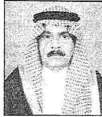
د. مطلق النجدي

يرعى خادم الحرمين الشريفين الملك عبدالله بن عبدالعزيز آل سعود حفظه الله اليوم، الأحد، المؤتمر الوطني الأول للجودة في التعليم العالي الذي تنظمه الهيئة الوطنية للتقويم والاعتماد الأكاديمي وكلية الإمامة بالرياض ويستمر ثلاثة أيام. وقال معالي وزير الدولة عضو مجلس الوزراء وزير التعليم العالي بالإنابة الدكتور مطلق بن عبدالله النقيسة أن هذه الرعاية تجسد اهتمام خادم الحرمين الشريفين الملك عبدالله بن عبدالعزيز آل سعود وسمو ولي عهده الأمين حفظهما الله بتطوير