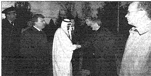
لقطات من وصول خادم الحرمين الشريفين الى تركيا وفي استقباله رئيس الجمهورية عبدالله غل

خادم الحرمين الشريفين وصاحب السمو الامير الدكتور بندر بن سلمان بن محمد آل سعود مستشار خادم الحرمين الشريفين وصاحب السمو الملكي الامير مشعل بن عبدالله بن عبدالعزيز وزير مفوض بمكتب وزير الخارجية وصاحب السمو الملكي المقدم طيار الامير تركي بن عبدالله بن عبدالعزيز وصاحب السمو الملكي الامير عبدالعزيز بن فهد بن عبدالعزيز وزير الدولة عضو مجلس الوزراء رئيس ديوان رئاسة مجلس الوزراء وصاحب السمو الملكي الامير محمد بن عبدالله بن عبدالعزيز ومعاللي وزير العمل الدكتور غازي بن عبدالرحمن القصيبي ومعاللي وزير المالية الدكتور ابراهيم بن عبدالعزيز العساف ومعاللي وزير الثقافة والاعلام الاستاذ ابيد بن امين مدني والشيخ مشعل بن عبدالله الرشيد ومعاللي رئيس الديوان الملكي الاستاذ خالد بن عبدالعزيز التويجري ومعاللي رئيس المراسم الملكية الاستاذ محمد بن عبدالرحمن الطليشي ومعاللي رئيس الشؤون الخاصة لخادم الحرمين الشريفين الاستاذ ابراهيم بن عبدالرحمن الطاسان ومعاللي مستشار خادم الحرمين الشريفين المشرف على العيادات الملكية الدكتور فهد العبد الجبار ومعاللي نائب رئيس الديوان الملكي الاستاذ خالد بن عبدالرحمن العيسى ومعاللي سفير خادم الحرمين الشريفين لدى الولايات المتحدة الامريكية الاستاذ عادل بن احمد الجبير ومعاللي قائد الحرس الملكي الفريق اول محمد بن محمد الصوهلي و سفير خادم الحرمين الشريفين لدى تركيا الدكتور محمد بن رجاء الحسيني. حفظ الله خادم الحرمين الشريفين في سفره واقامته.