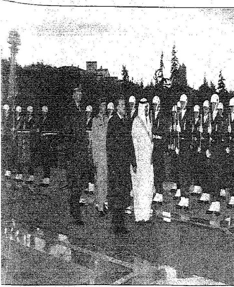
الملك المنفي والرئيس التركي يستعرضان حرس القصر الجمهوري