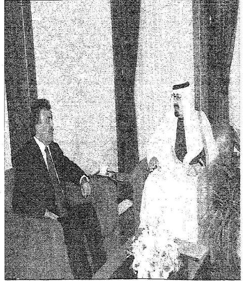
خادم الحرمين الشريفين خلال اجتماعه والرئيس عل في القصر الجمهوري بالقاهرة

وزيرا الخارجيتين يعقدان اجتماعا في القصر الجمهوري