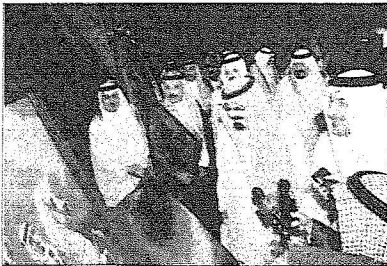
..ويطالع ايده الله على لوحة فنية