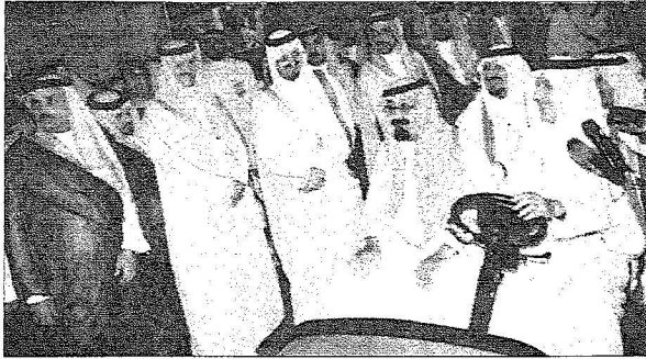
المليك وولي العهد الامين يتجولان داخل اجنحة المعرض