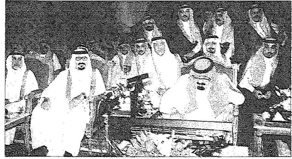
خادم الحرمين الشريفين خلال تدشين احد المشروعات بحضور ولي العهد