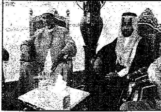
مفتي سَهَل البَدَاوِي الذي استقبله الحِكر في دار التَّوَرَّى