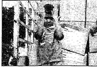
ظَلُّ لَبْنَانِي يَرِوِّعُ بِيَدِهِ فِي صَوْرَةِ مَعْرِمَةَ