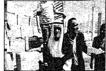
مَوَاطِنُ لَبْنَانِي يُشَلِّمُ حَمَلَهُ مِنَ المَسَاعَدَةِ السَّوْعِيَّةِ

وصول الدفعة الثانية من الجسر البري الإغاثي السعودي إلى لبنان.. وإقامة ١٥ خيمة إفطار رمضانية