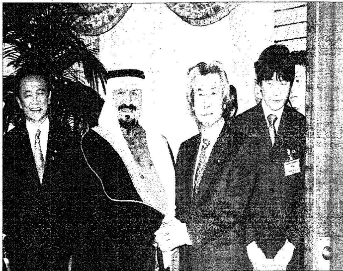
...وضام رئيس الوزراء.