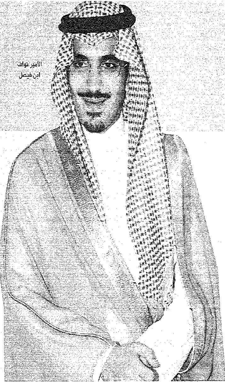
الأمير نواف ابن فيصل

الرياضة الدراسية مفة وودة والأمير محمد بن فهد عشر عليها