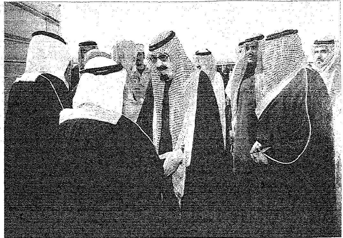
خادم الحرمين الشريفين لدى استقباله الوزراء في روضة خريم قبيل الجلسة