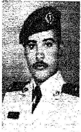
الملك الراحل إبراهيم الشويمان

بكل الحب والوفاء نستقبل خادم الحرمين الشريفين وولي عهده الأمين