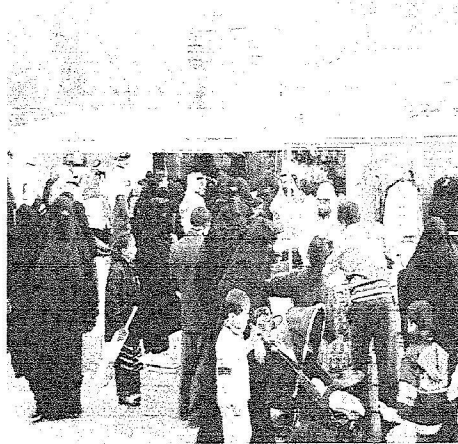
لشبان لاسرائيل منطقة قصر الحكم