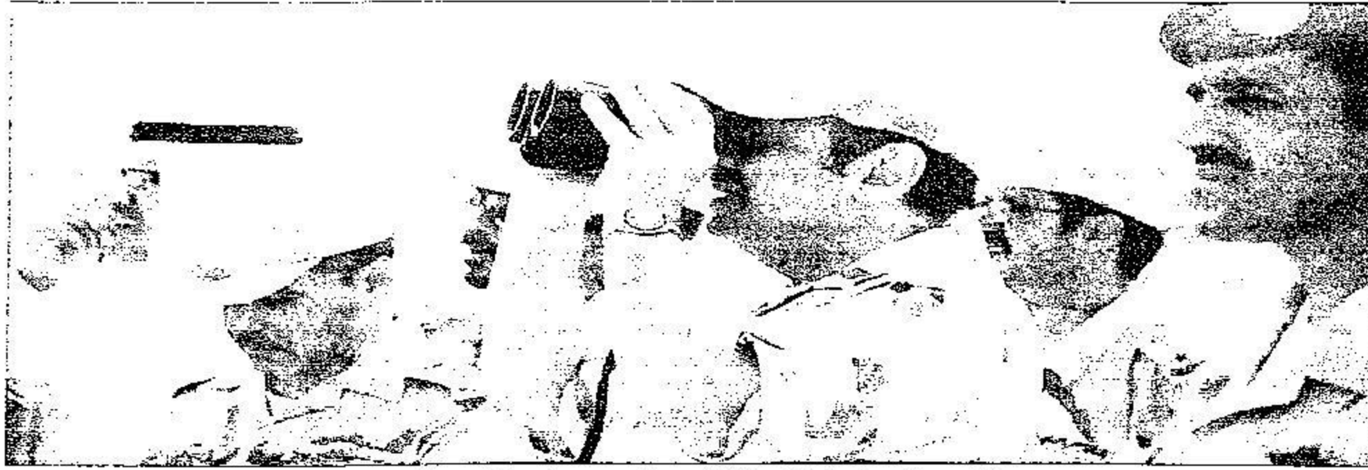
الأمير خالد بن سلطان يستكشف مواقع حدودية بمنظار عسكري

ولفت مساعد وزير الدفاع والطيران أثناء جولته التفقدية لقطاعات قوة جازان