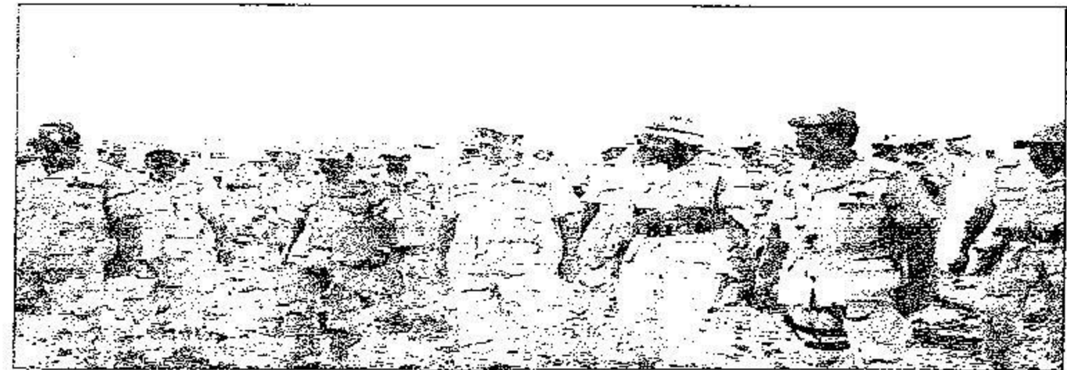
الأمير خالد بن سلطان متفقداً مواقع عسكرية على الشريط الحدودي - جازان أمس