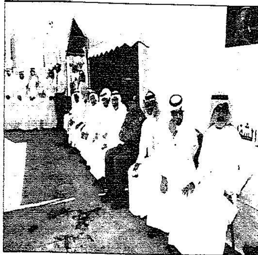
عدد من المسؤولين خلال حضورهم الجولة