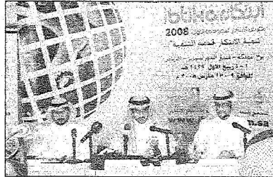
لقطعتان من الفعاليات