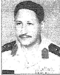
الملك عبد الله بن عبد العزيز

وأضاف أن هذه الزيارة تعني أن قيادتنا معنا في كل الأوقات وتعني لنا الوحدة والوفاق بين القيادة والشعب بين القائد وجنده وأن خادم الحرمين الشريفين يجوب مناطق المملكة لا شدي إلا لأنه يحمل هم هذه الأمة ويحرص بحفظه الله على أن يطالع بنفسه على احتياج الوطن والمواطن من مشاريع تنموية وغيرها وهذا ليس