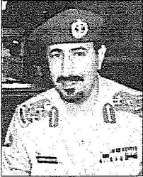
الأمير سعود بن عبد العزيز

وأضاف أن أبناء المنطقة يجدونها فرصة كبيرة للتعبير عما في نفوسهم من الحب والولاء لخادم الحرمين الشريفين ومنطقة تبوك كغيرها من مناطق