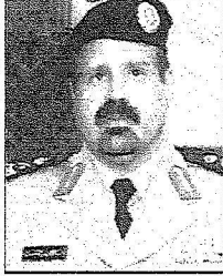
الأمير فالح بن عبد العزيز

وأكد أن شجاعة الملك عبد الله ووفيقته الحازمة والصارمة ضد المفسدين في الأرض وحربه على الإرهاب ودعائه تاج زين جبين الوطن والمواطن. وأما رعايته أبناء الشهداء فهي دليل