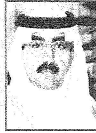
الأمير فيصل بن عبدالله بن محمد