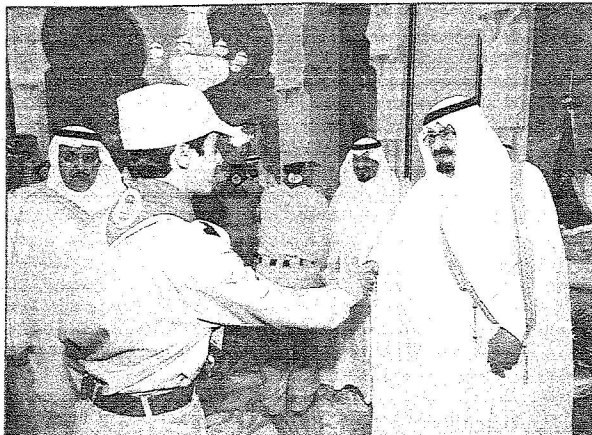
..ويصانح احد منسوبي الكتفانة المشاركين في خدمة الحاج