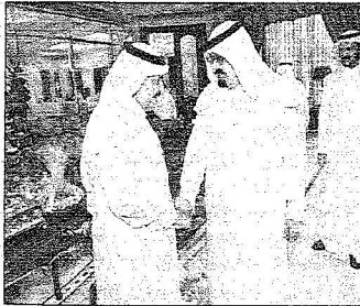
.. ويتبادل الحديث مع الأمير نايف