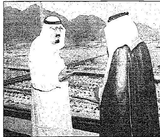
المليك يتبادل الحديث مع ولي العهد في قصر مني