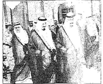
خادم الحرمين يرافق ولي العهد في مقعدة مستقبليه