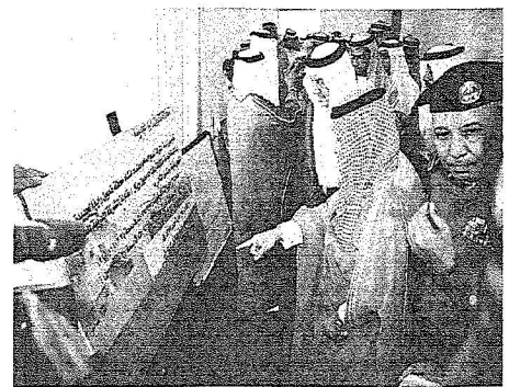
الأمير خالد الفيصل أثناء تدشين المشاريع التنموية عبر الشاشة المرئية