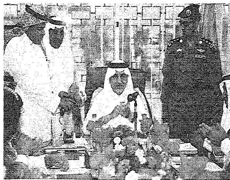
ويصفق ابتهاجا بالاضافة للتنمية الجديدة لرابغ