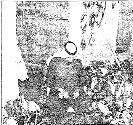
الحرف -الشرقاوية، في المهرجان