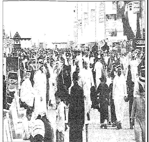
مظهر مكثف يرميها بالجندرية