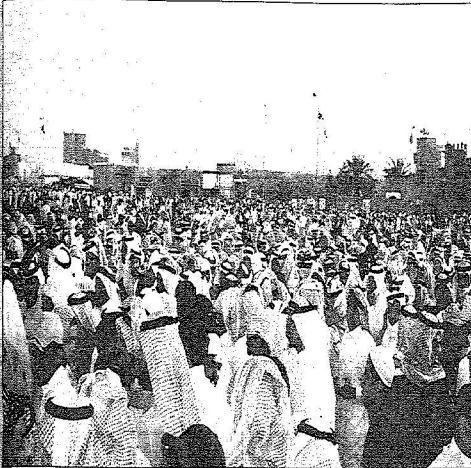
جماهير نظيرة يتسابق في مقر المهرجان