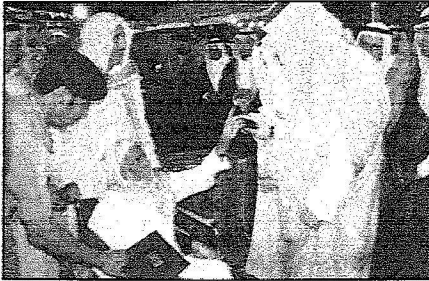
لحد المستفيدين يقسم وثيقة منزله