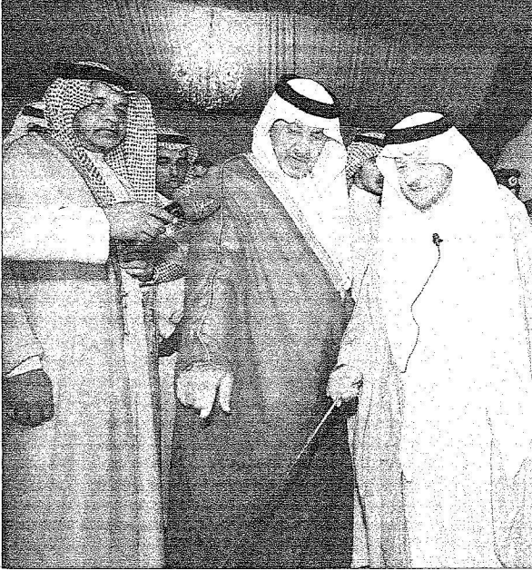
سموه يستمع لشرح عن مشاريع الحج من الدكتور حبيب زين العابدين

القيادات العاملة في الحج وأعضاء لجنة الحج المركزية ورؤساء القطاعات الحكومية المعننية بخدمة الحجاج والقيادات الأمتية.