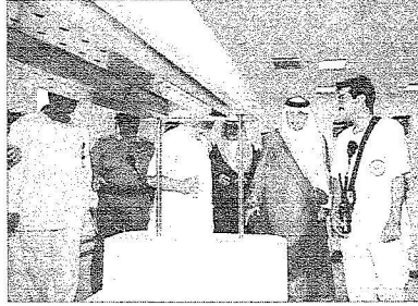
ويتفقد الخدمات الصحية المقدمة للحجاج

وفي نهاية الجولة أشاد سمو الأمير خالد الفيصل بما شاهد من مشاريع خدمية راقية اتفقت عليها الدولة بنسحاء في سبيل تقديم أفضل الخدمات لحجاج بيت الله الحرام مبدياً تقدير لجهود الجميع متمنياً لهم المزيد من التوفيق سائلاً الله تعالى أن يحفظ للمملكة أمنها