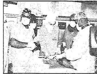
ممرضات سعوديات شاركن في العملية