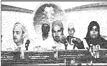
جانب من المؤتمر الصحي