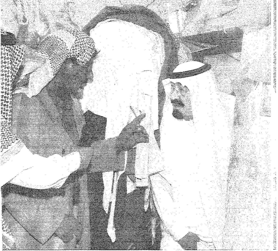
زيارة خادم الحرمين للاحياء الفقيرة