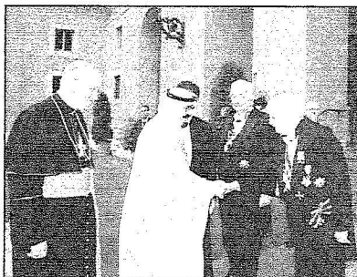
خادم الحرمين الشريفين ورئيس الوزراء الإيطالي خلال لقاء رجال الأعمال