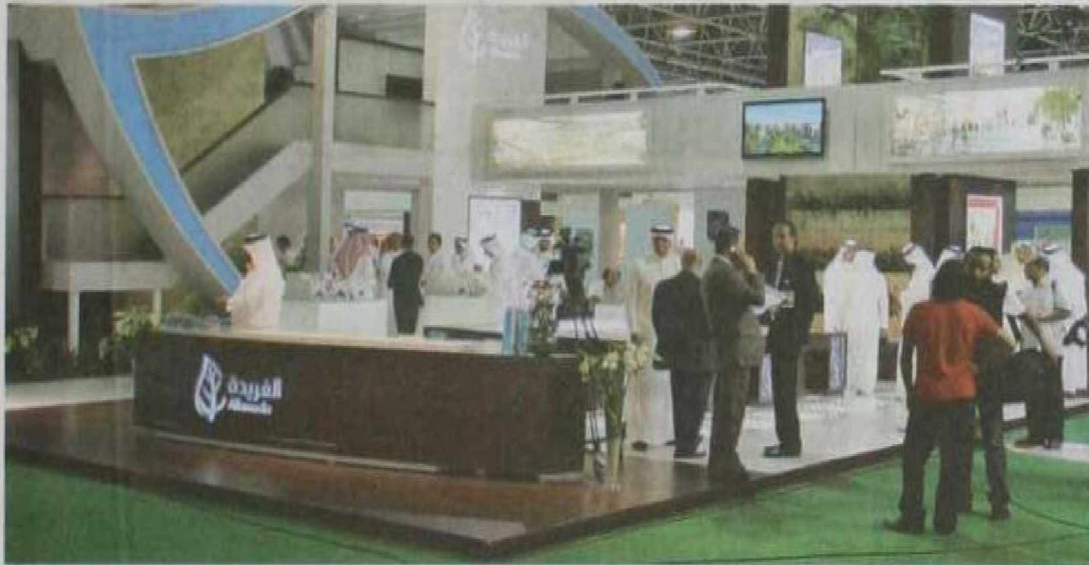
رحلتي في افتتاحه بحضور لافت من رجال الأعمال والعقاريين، ويبدو جناح مشروع الفريدة